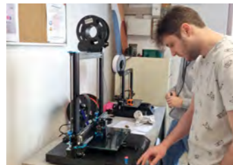
Une fabrique du Numérique à Marcq-en-Barœul dans le quartier de la Briqueterie