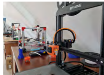
Une seconde dans la ville de Hem à la Ferme Braquaval

Le FCP a fait le choix de se lancer dans une expérimentation autour de l'innovation numérique à fort impact social. La FabNum est aussi, naturellement, un acteur économique et social, pour les lieux de vie et d'échanges de nos territoires que sont nos villes et quartiers.